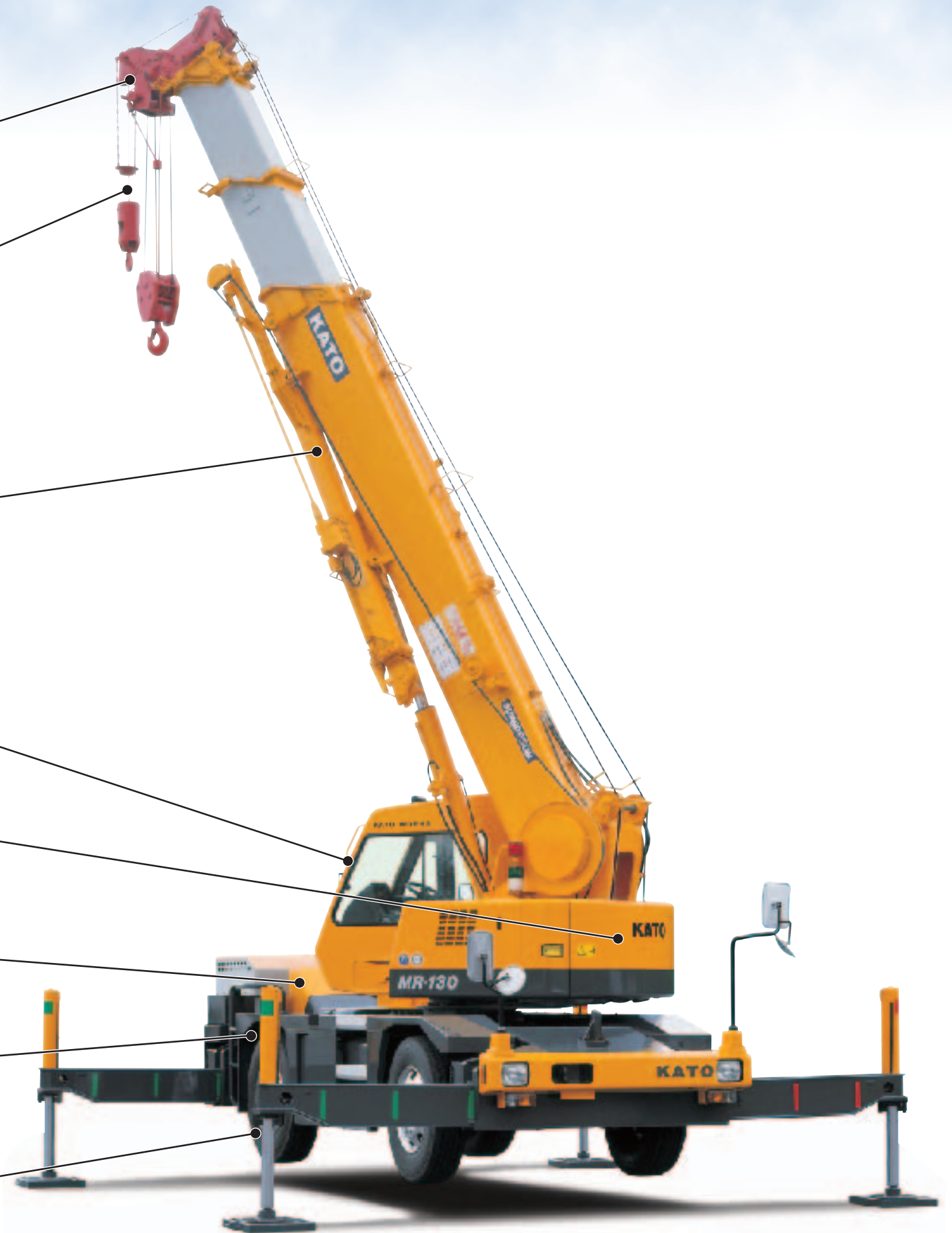
MR-130 (MR-130M) はラフターの愛称で、クレーン型式名はKRM-13H (13tつり) (KRM-13HM (4.9tつり)) です。

サスペンションロック機構を標準装備。 走行吊り性能、安定感アップ 作業姿勢での現場内移動の安定感もアップ。