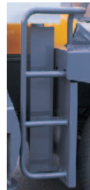
●後方サイドステップ