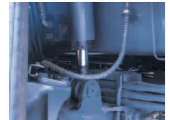
●サスペンションロックシリンダー