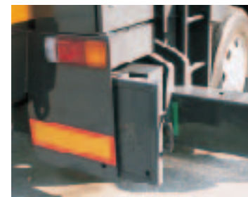
●アウトリガ敷板格納ボックス