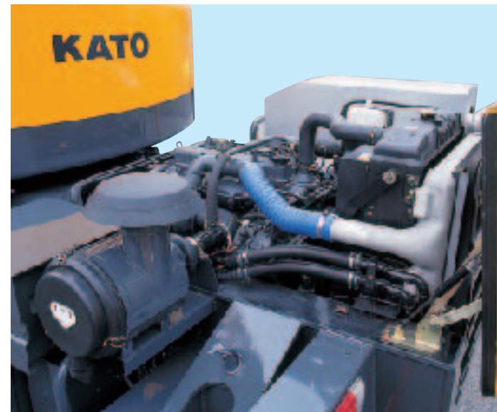
●点検用フルオープンエンジンルーム