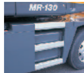
●アルミサイドステップ